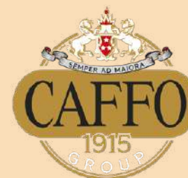
CAFFO GROUP caffo.com