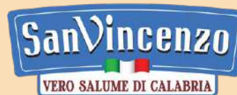
SAN VINCENZO sanvincenzosalumi.it